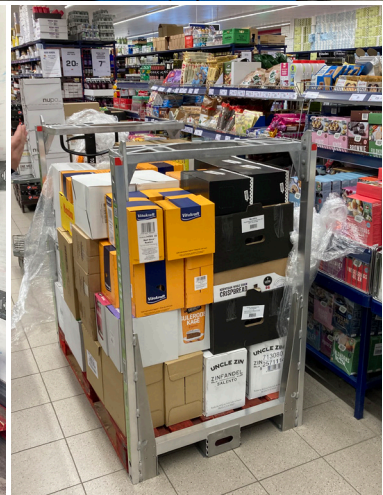
Markante gevinster gennem hele logistikkæden med dobbeltstabling