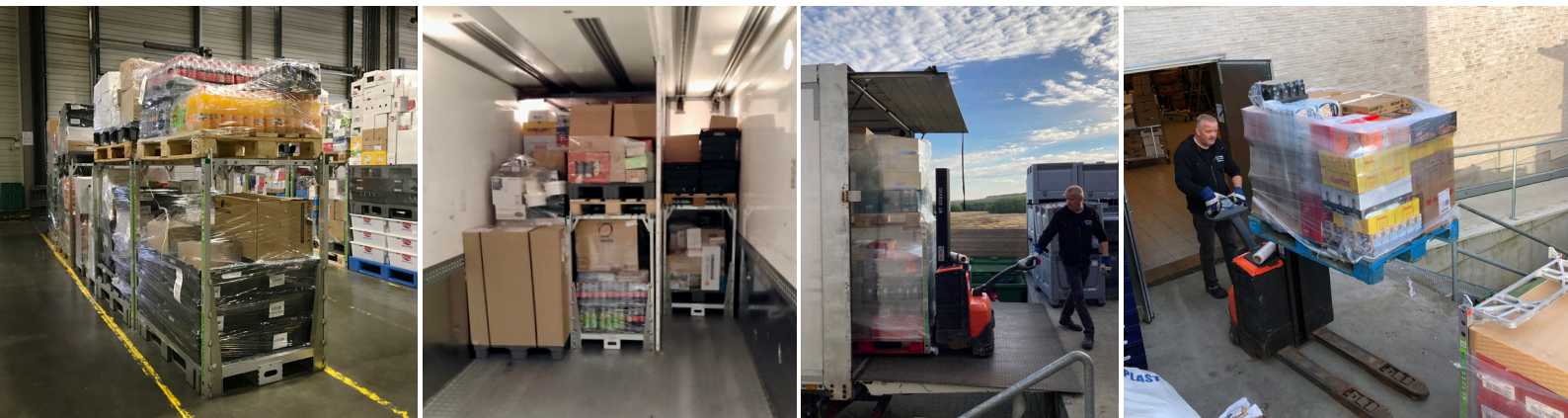
Dobbeltstabilede varer gør distributionen både grønnere, billigere, hurtigere og ergonomisk bedre at håndtere.